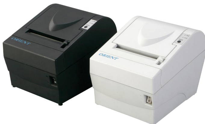
پرینتر حرارتی صادر کننده قبض