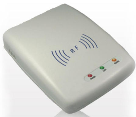
دستگاه کارت خوان

خود کار تمامی خدمات ارائه شده به کاربر اعم از پرینت، دانلود، ساعت و مبلغ اینترنت استفاده شده و ... محاسبه شده است. نمونه سخت افزار برنامه را در زیر می توانید مشاهده فرمائید.