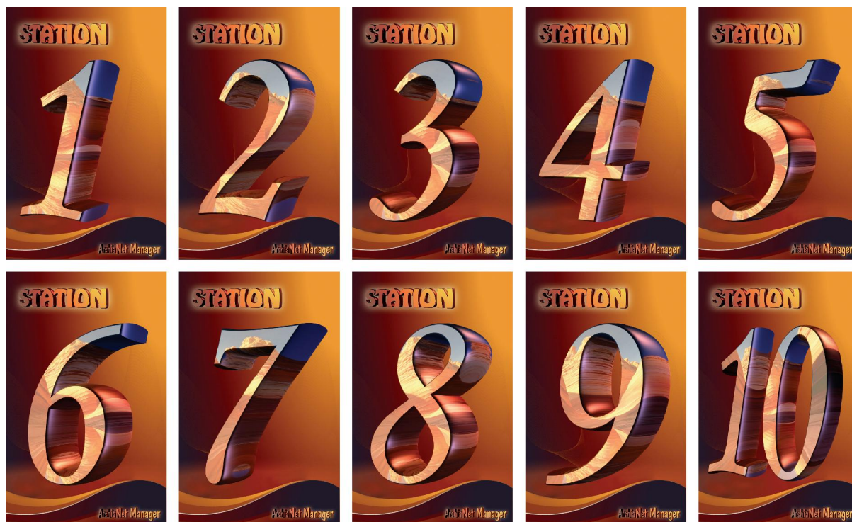
نمونه کارت های بدون تماس برای هر کلاینت